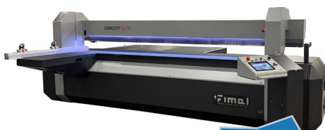
Fimal Concept 350 Elite Druckbalkenformatkreissäge

46.800 €* oder 635 €* im Monat statt 51.779 €