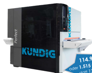
Kündig Perfect-2 1350 REd-L High-End Breitbandschleifmaschine

114.999 €* oder 1.515 €* im Monat statt 126.100 €