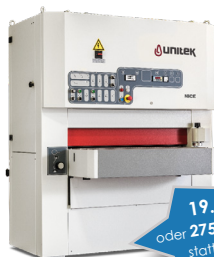
Unitex Nice NKRT 970 Breitbandschleifmaschine

19.999 €* oder 275 €* im Monat statt 22.420 €