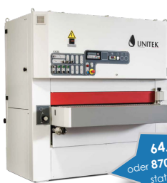
Unitex Excel 2 NRKRT Breitbandschleifmaschine mit Lackpaket

64.500 €* oder 870 €* im Monat statt 72.060 €