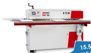
Lange B 72 KF Kantenanleimmaschine

15.500 €* oder 215 €* im Monat statt 17.675 €