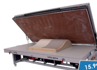
MSM VPS 3514 Professional Multifunktionale Vakuumpresse

15.999 €* oder 222 €* im Monat statt 18.133 €