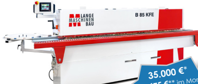
Lange B 85 KFE Kantenanleimmaschine

35.000 €* oder 475 €* im Monat statt 40.420 €